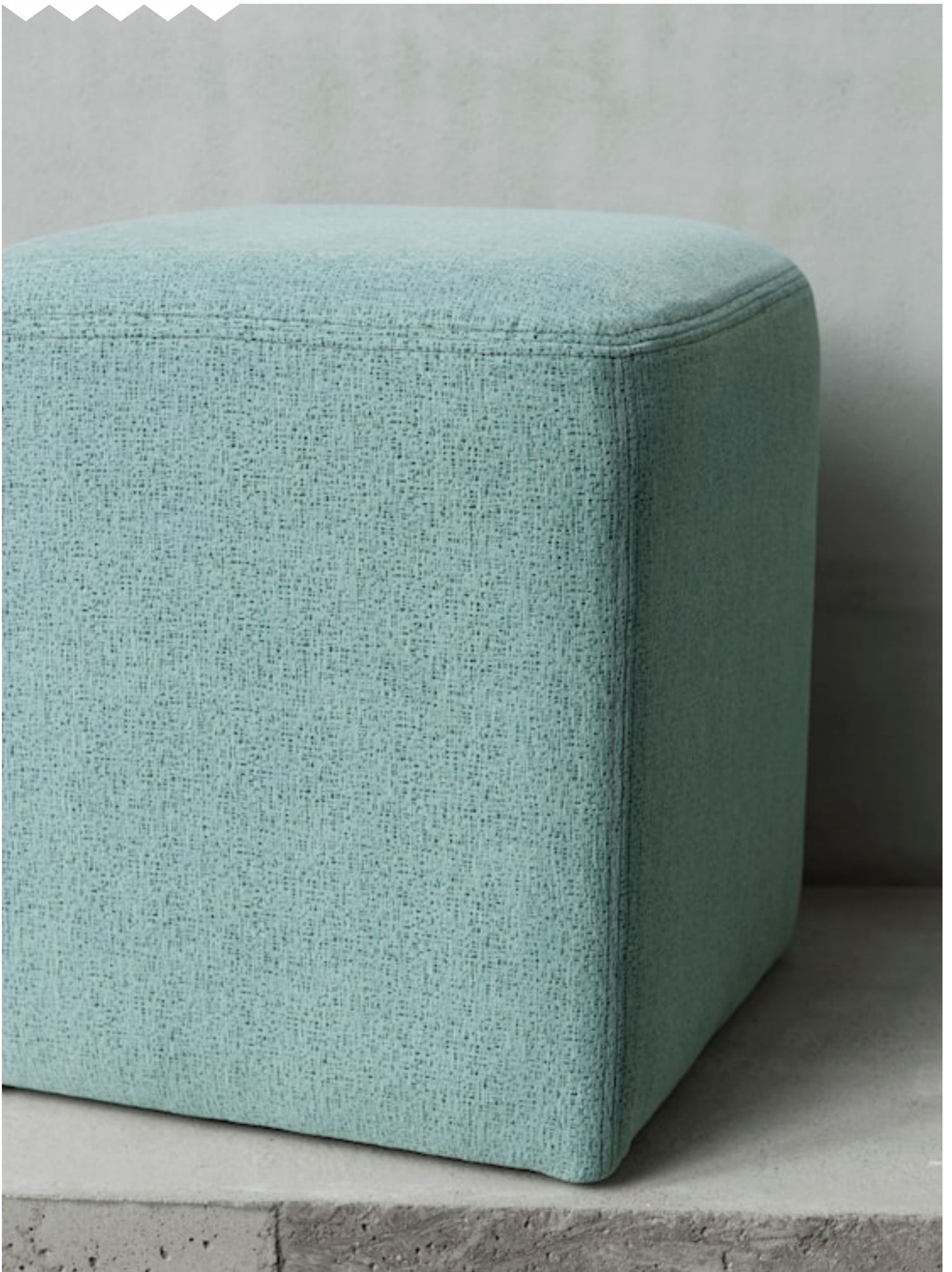
VELVET UNIT Upholstery fabrics