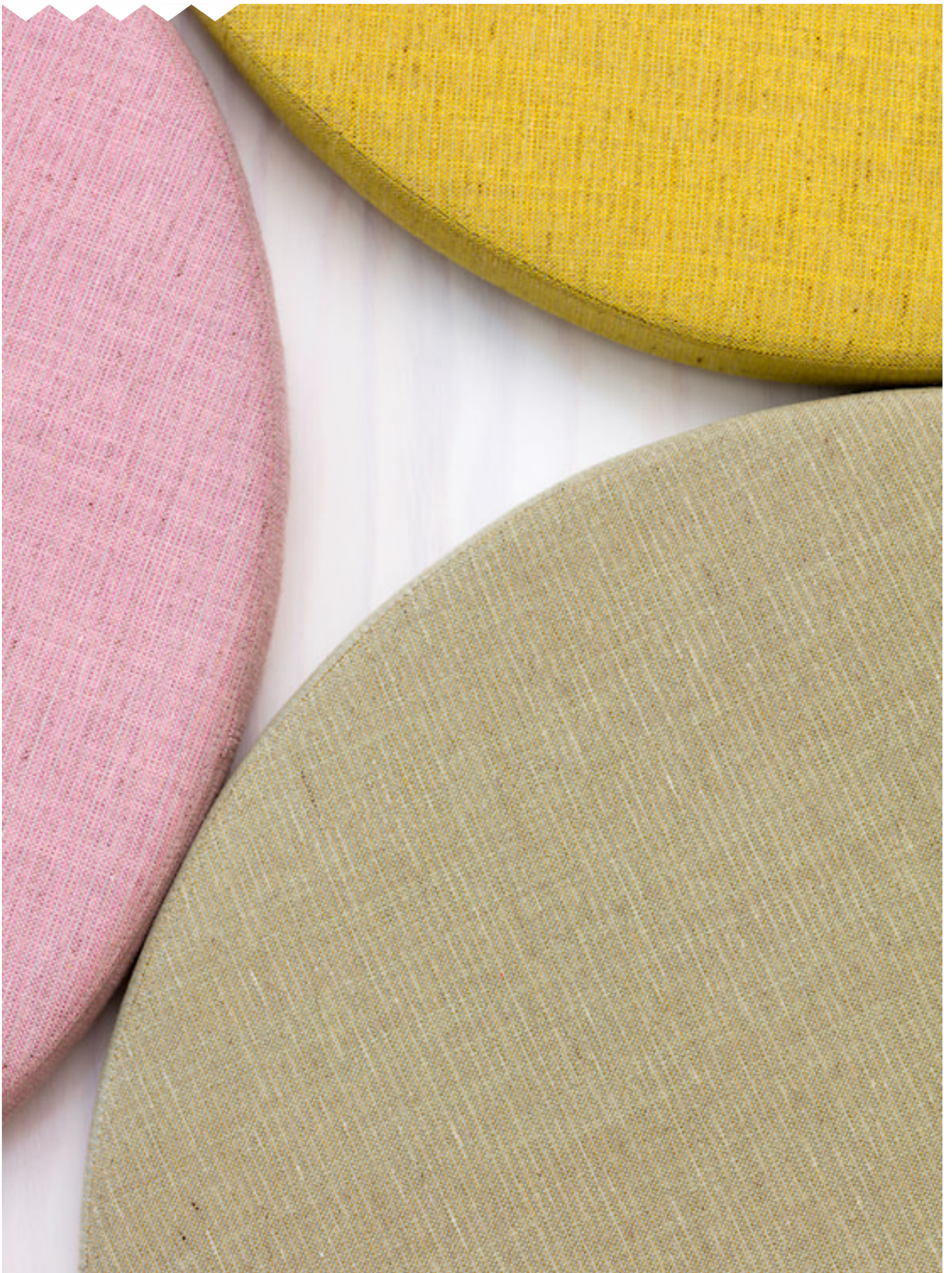
HARPER Upholstery fabrics