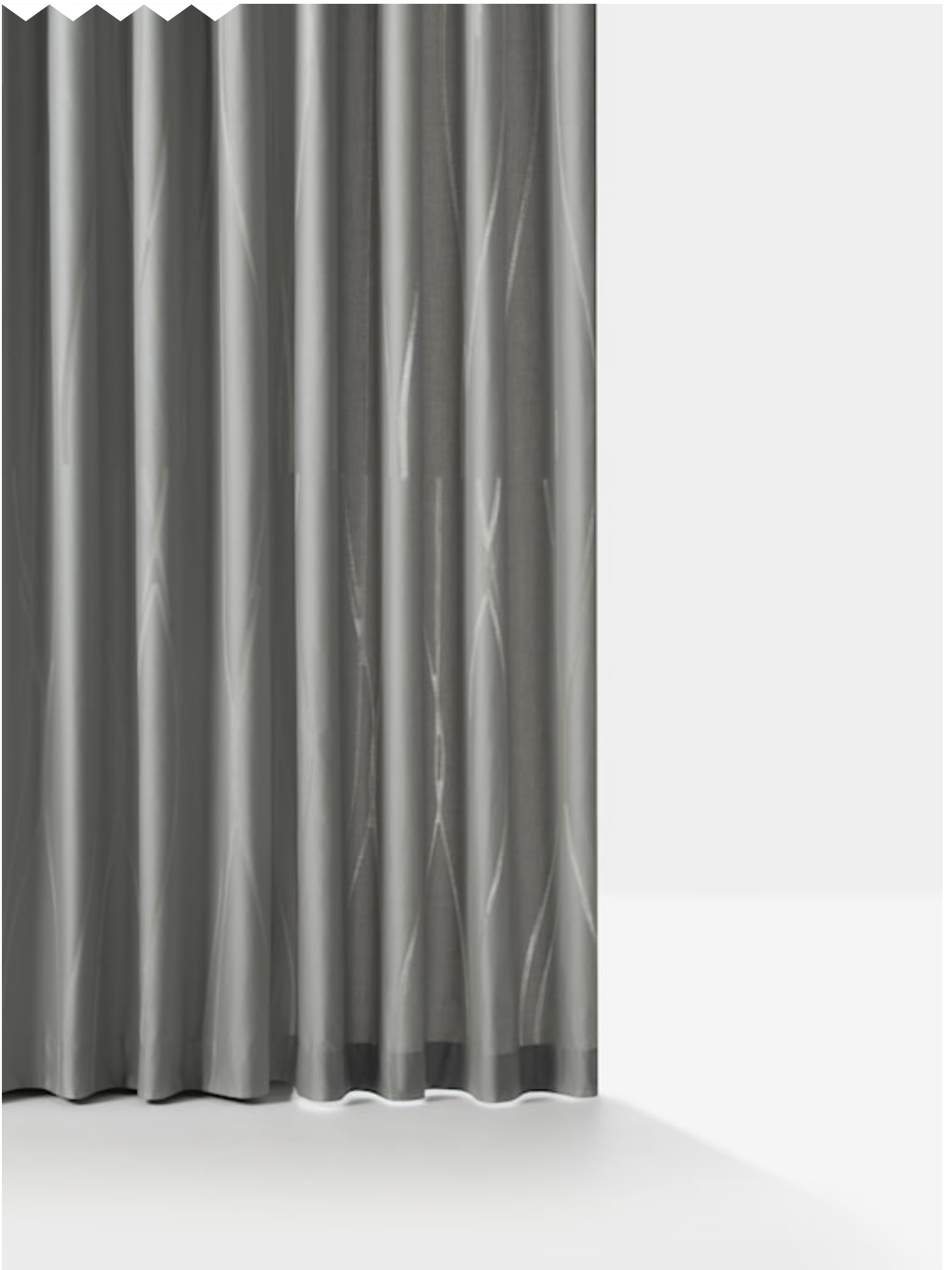
PRISM Hanging fabrics