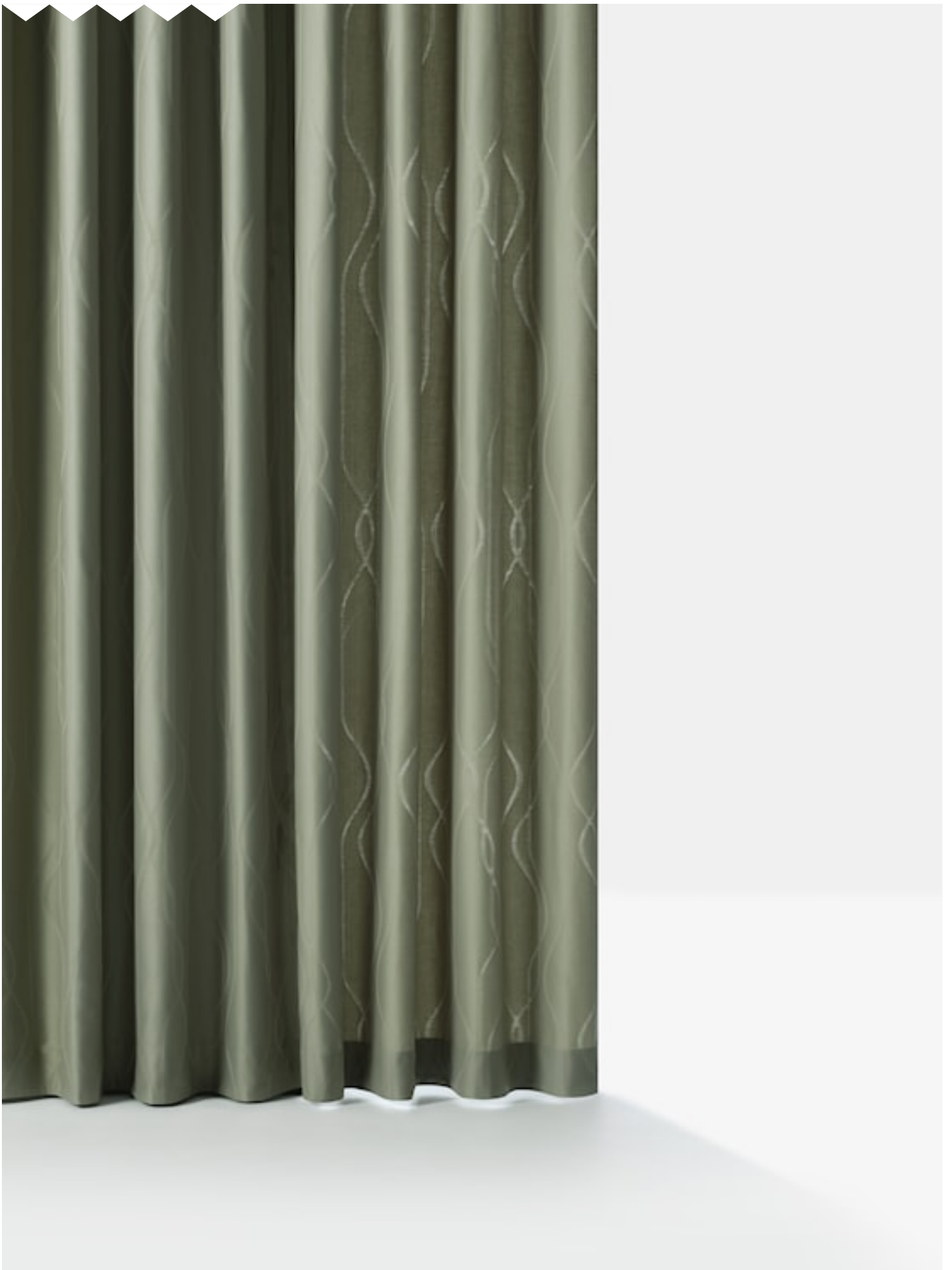
GLORY Hanging fabrics