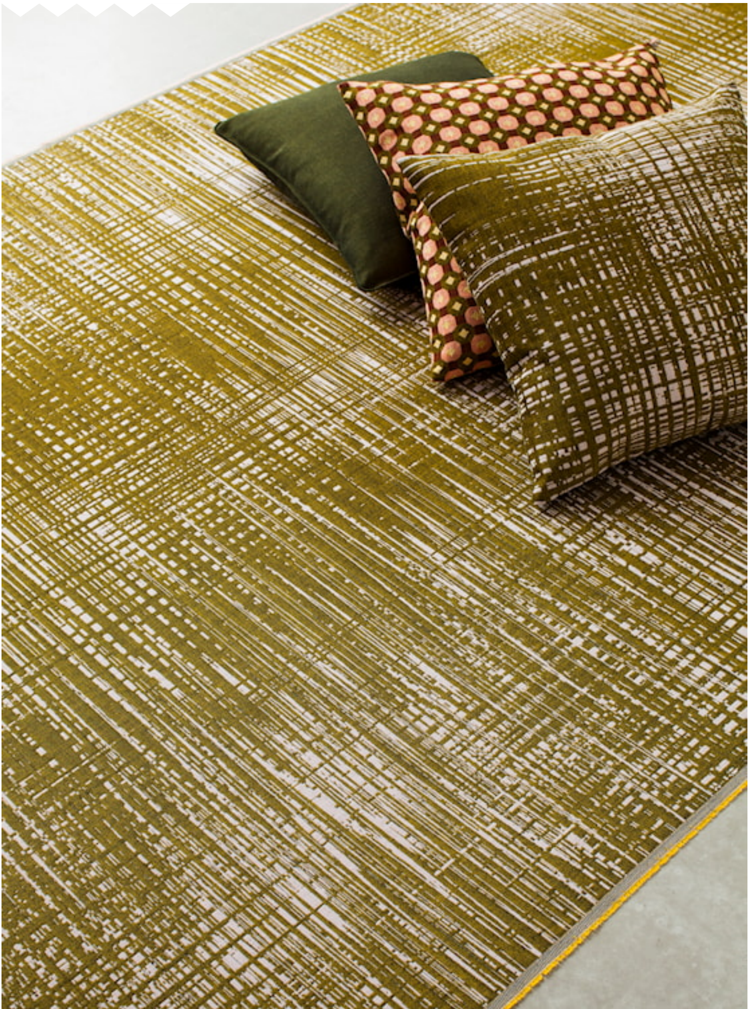
ACCESSOIRE SILK Upholstery fabrics