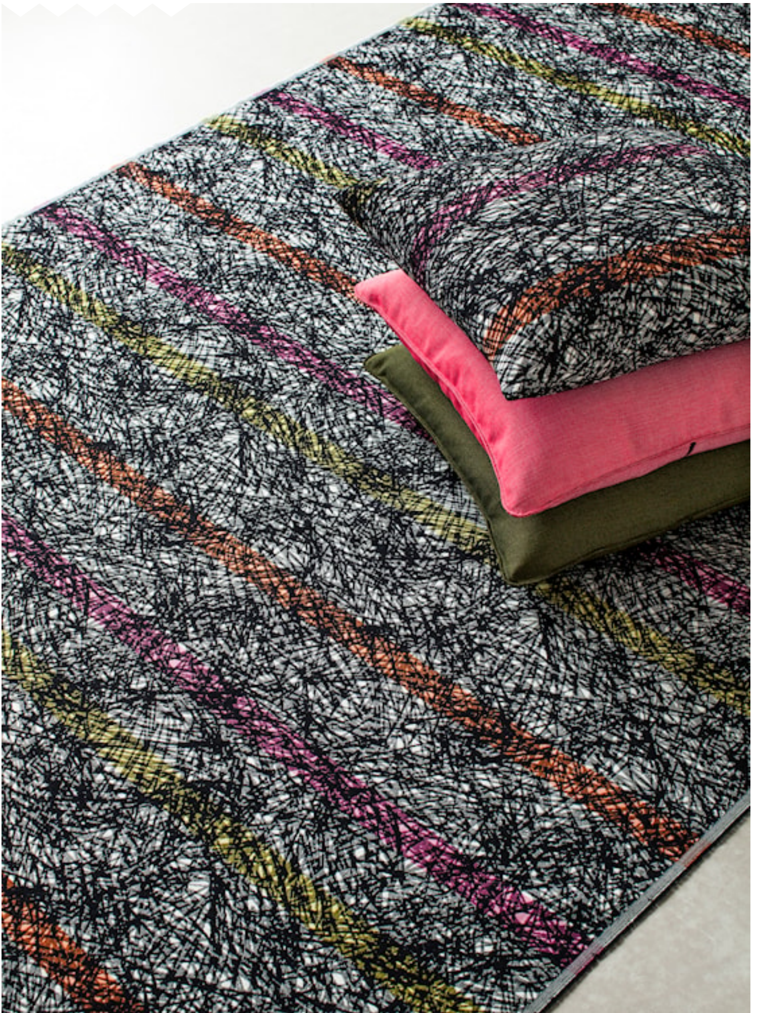
ACCESSOIRE INFRA Upholstery fabrics