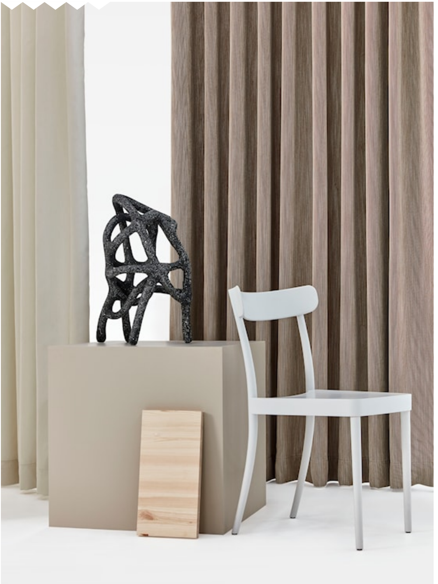
TWIN Hanging fabrics