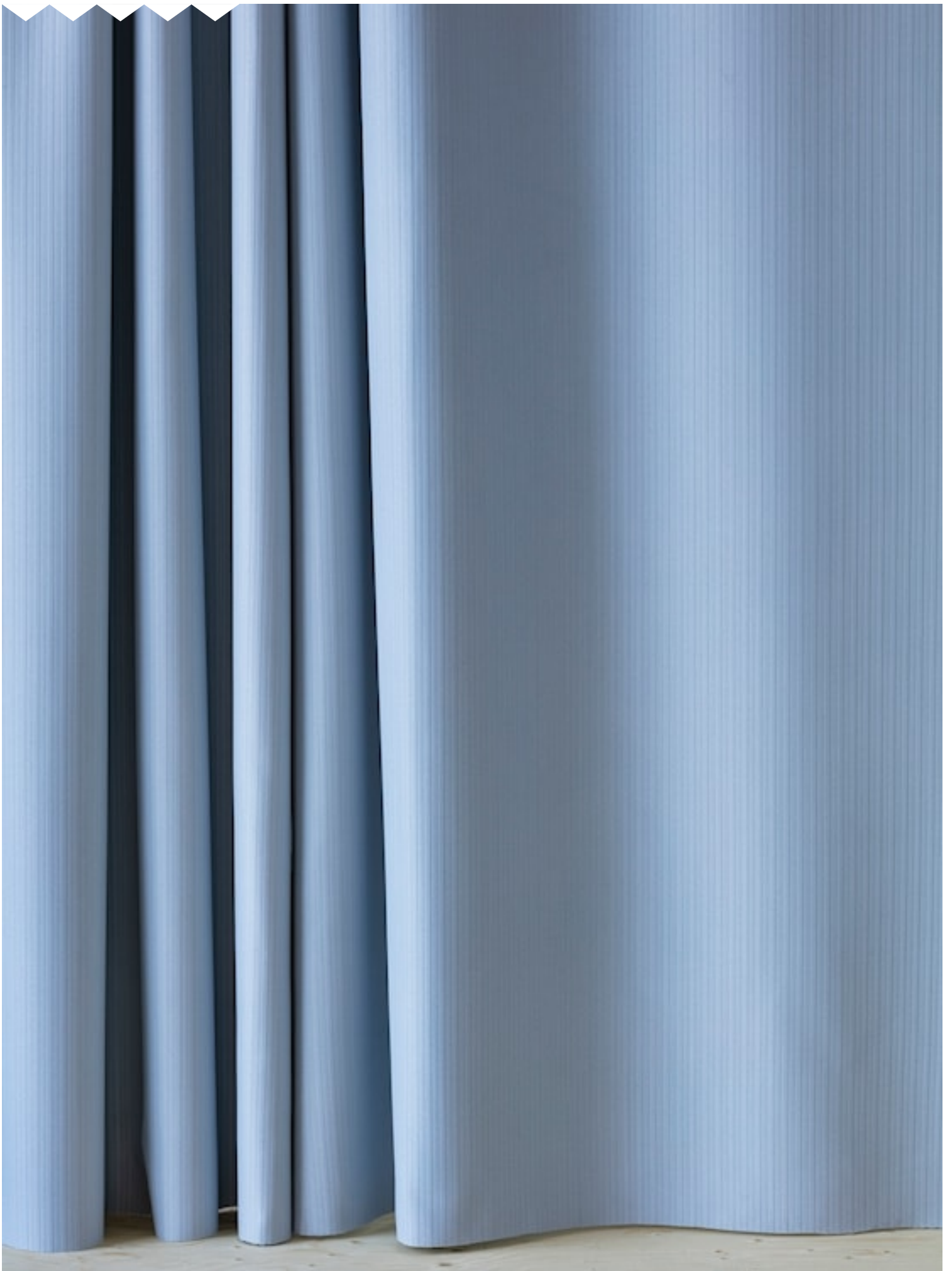
CALLA Hanging fabrics