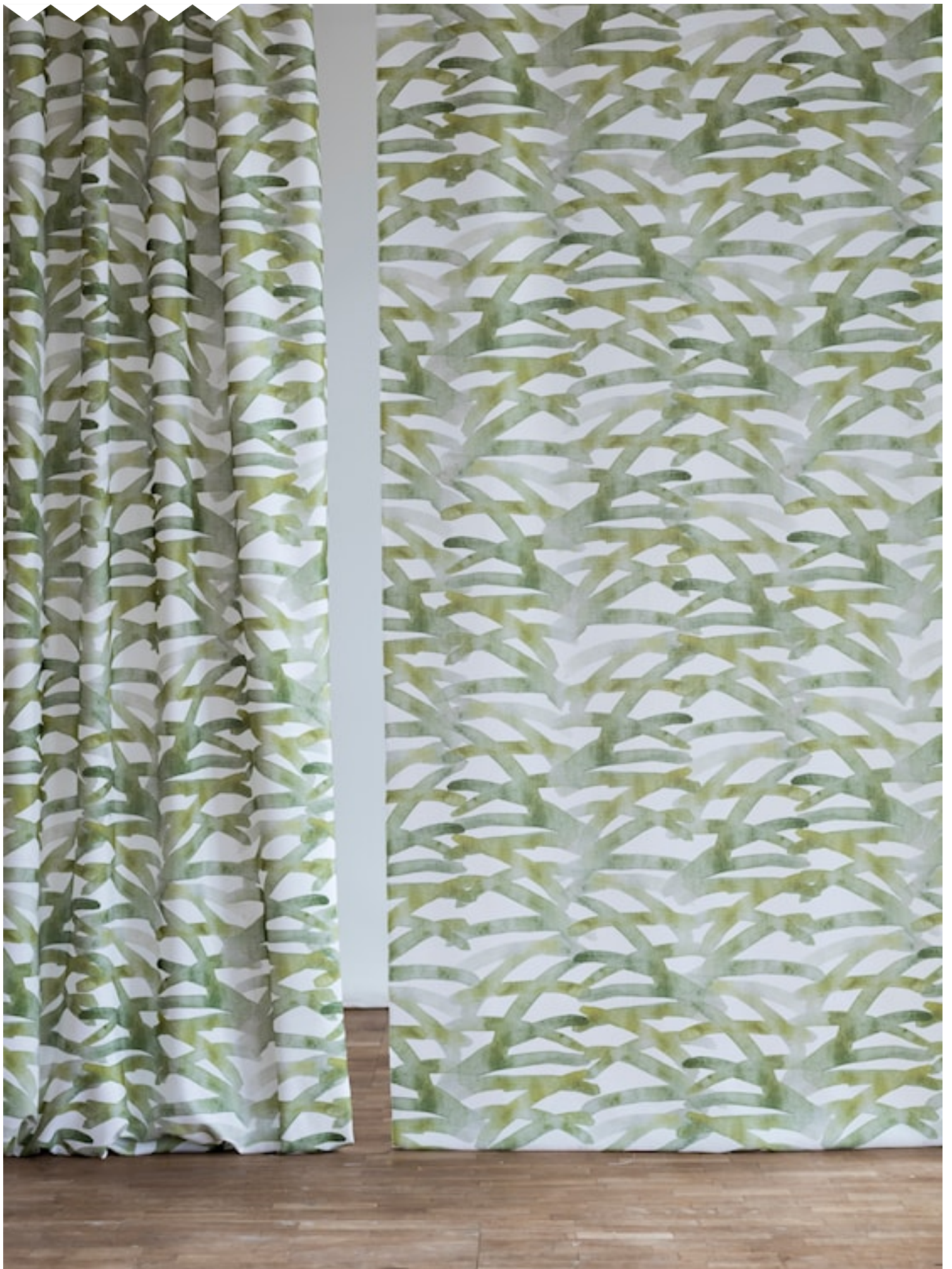
SAWA Hanging fabrics